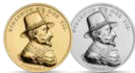
Zygmunt III Waza (1587–1632) Emisja: 23 I 2020 r.