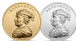
Aleksander Jagiellończyk (1501–1506) Emisja: 7 XII 2016 r.