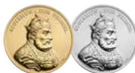
Zygmunt I Stary (1506–1548) Emisja: 12 VII 2017 r.