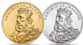
Kazimierz Wielki (1333–1370) Emisja: 3 III 2014 r.