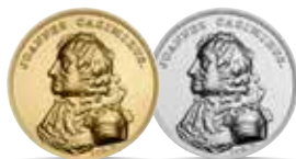
Jan Kazimierz Waza (1648–1668) Emisja: 26 I 2021 r.