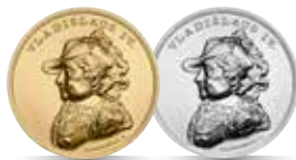
Władysław IV Waza (1632–1648) Emisja: 3 XII 2020 r.