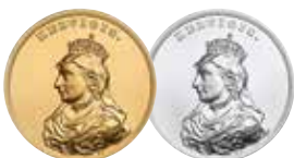
Jadwiga Andegaweńska (1384–1399) Emisja: 4 XII 2014 r.