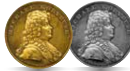
Michał Korybut Wiśniowiecki (1669–1673)