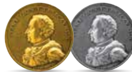
Stanisław Leszczyński (1705–1709, 1733–1736)