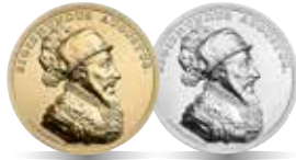
Zygmunt August (1548–1572) Emisja: 7 XII 2017 r.