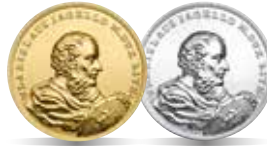
Władysław Jagiełło (1386–1434) Emisja: 3 III 2015 r.