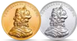
Wacław II Czeski (1291–1305) Emisja: 22 V 2013 r.