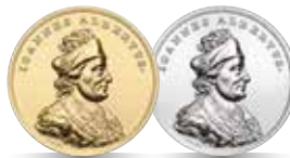
Jan Olbracht (1492–1501) Emisja: 14 VI 2016 r.