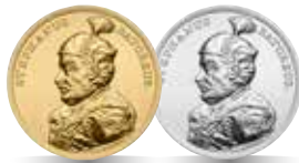
Stefan Batory (1576–1586) Emisja: 17 I 2019 r.