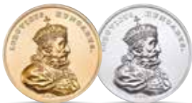
Ludwik Węgierski (1370–1382) Emisja: 10 IX 2014 r.