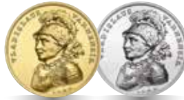
Władysław Warneńczyk (1434–1444) Emisja: 15 IX 2015 r.