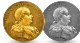
Jan III Sobieski (1674–1696)