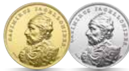
Kazimierz Jagiellończyk (1447–1492) Emisja: 3 XII 2015 r.