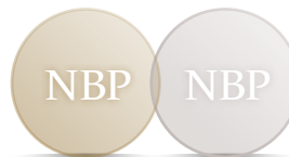
Stanisław August Poniatowski (1764–1795)